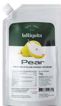
Pera Bolsa 1 kg CÓD. 0010190