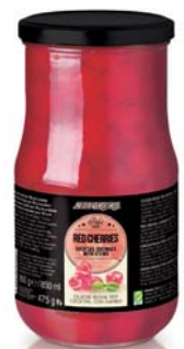
Cereza roja Bote cristal 950 gr