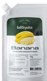
Plátano Bolsa 1 kg CÓD. 0010184