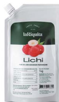
Lichi Bolsa 1 kg CÓD. 0010524