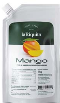
Mango Bolsa 1 kg CÓD. 0010188