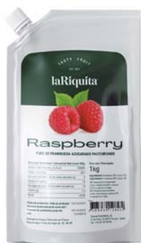
Frambuesa Bolsa 1 kg CÓD. 0010187