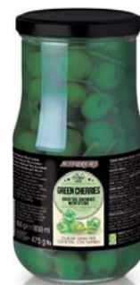
Cereza verde Bote cristal 950 gr