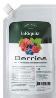
Frutos rojos Bolsa 1 kg CÓD. 0010186