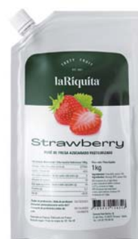
Fresa Bolsa 1 kg CÓD. 0010185