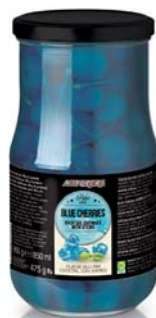
Cereza azul Bote cristal 950 gr

Productos pensados para acompañar mejor cada concentrado de cóctel, imprescindible para la perfecta preparación de cócteles internacionales y tragos largos.