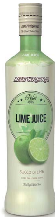
Lima juice Botella 700 ml CÓD. 0010500