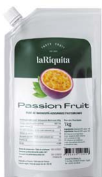
Maracuyá Bolsa 1 kg CÓD. 0010189