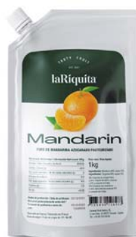
Mandarina Bolsa 1 kg CÓD. 0010674