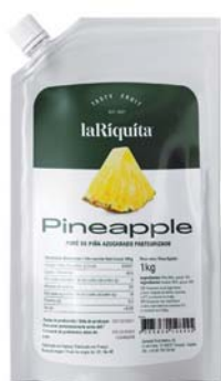
Piña Bolsa 1 kg CÓD. 0010183