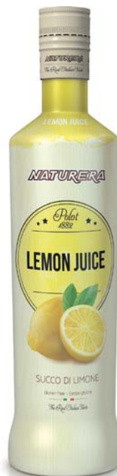
Lemon juice Botella 700 ml CÓD. 0010495